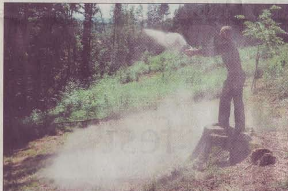
Vom Winde verweht. Eine einfache Waldbestattung ist ab 250 Franken zu haben.